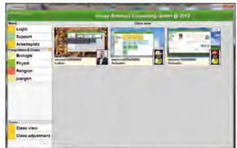
▲ Steuerungsseite für den Frontalunterricht.