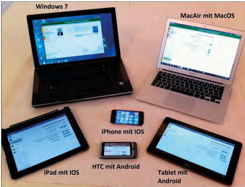
▲ Bildungscloud 2nd Level: ClassAPP der ASC läuft auf allen derzeit bekannten Betriebssystemen und Hardwareprodukten.

Bundes- und Landesbehörden wie Kultus- Finanz- und Wirtschaftsministerien, Städte, Kommunen und Landkreise von der Nordsee bis zu den Alpen und Unternehmen aus den Bereichen Kommu- nikation, IT, Logistik, Luftfahrt, Touristik, Einzelhandel, Großhandel, Banken und Versicherungen